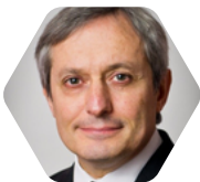
François Girard Centre - Pays de Loire